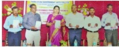
திருவாரூர் திருவி.க. கல்லூரியில் நடைபெற்ற கருத்தரங்கில் சம்பங்கப்பட்ட ஆய்வுக் கட்டுரைகளுடன் பேராசிரியர்கள்.

திருவாரூர், பிப். 3: திருவாரூர் திரு.வி.க. அரசு கலைக் கல்லூரியில் 'நீர் மேலாண்மை பிரச்சனைகளும், அதன் தீர்வுகளும்' என்ற தலைப்பில் தேசியக் கருத்தரங்கம் அண்மையில் நடைபெற்றது.